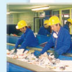
Centre de tri (Le Mans)

Au centre de tri, les bouteilles et les flacons en plastique PET/PEHD sont séparés des autres emballages, compactés en balles et envoyés dans une usine de recyclage.