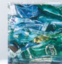
Balle de PEHD

Le PEHD est broyé et transformé en granulés. Ces granulés sont fondus et servent à la fabrication de tubes, flacons non-alimentaires et de bacs de collectes de déchets ménagers.