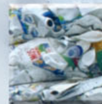
Balle de PET

Le PET est broyé puis fondu et transformé en fibres par étirage. Cette fibre sert à rembourrer des anoraks, des peluches ou des couettes, et à fabriquer des vêtements.